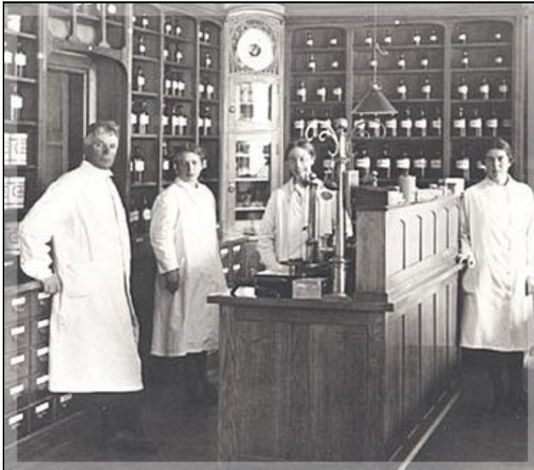
Äntligen har Läkemedelsverket inför ett nytt licenssystem!